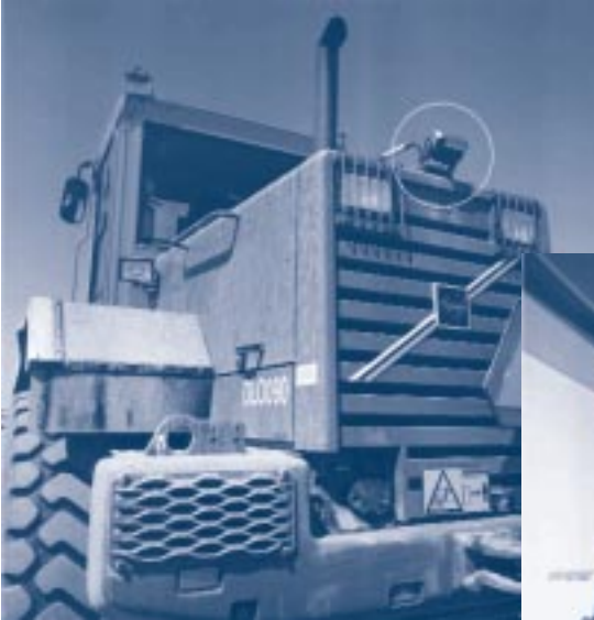
Camera achter op machine