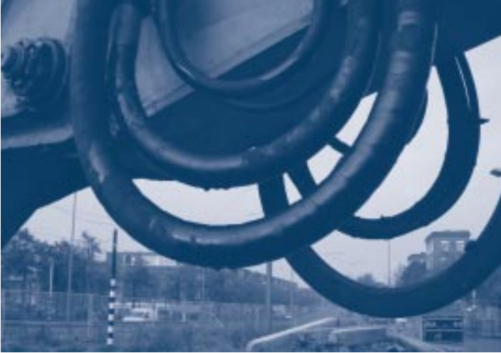
Hydraulische olie lekkage

In de handleiding (manual) van de betreffende machine staat gedetailleerde informatie over het gebruik. Het is onnodig om te vermelden dat de machinist de manual grondig moet kennen. Om gevaar voor struikelen en uitglijden te voorkomen, moet er tevens voor worden gezorgd dat handen, schoenen, handgrepen, opstappen, de cabine, bedieningshandels en dergelijke schoon blijven. Er mogen geen losse voorwerpen in de cabine liggen.