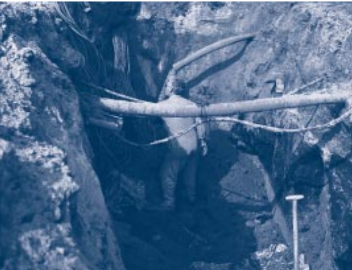
Kabels en leidingen in de grond

Bij een zachte of ongelijkmatige ondergrond kunnen gevaarlijke situaties ontstaan door wegzakkende of omvallende machines. Het bouwterrein dient vooraf te worden beoordeeld op draagkracht en begaanbaarheid, en er dienen passende maatregelen te worden genomen. Als hulpmiddel kan een beoordelingsstelsel van CUR, Stichting Arbow en CROW worden gebruikt, zoals het BVS (Begaanbaarheids Vergeljkings Stelsel) en het BBS (Begaanbaarheids Berekenings Stelsel) voor begaanbaarheid met voertuigen. Voor meer informatie zie Begaanbaarheid Bouwterreinen (CUR VC44).