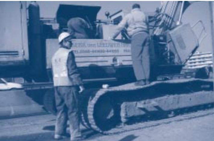
Onderhoud: vervangen van oliefilter

Veilig werken met grondverzetmachines hangt nauw samen met de onderhoudstoestand van het materieel. Het is daarom van groot belang tijdig onderhoud uit te voeren. In het instructieboek staat de informatie die nodig is om de onderhoudswerkzaamheden vakkundig uit te voeren. Voor bepaalde reparaties zijn specialisten nodig.