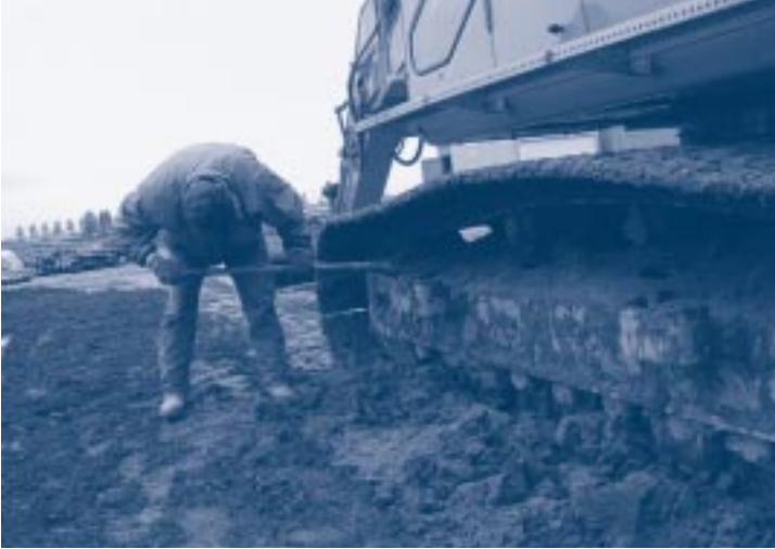
Het schoonmaken van de rupsbanden