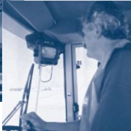
Monitor in cabine