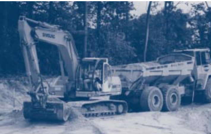
Graafmachine met dumper

De machinist van de grondverzetmachine speelt een belangrijke rol bij het voorkomen van ongelukken. In dit advies wordt daarom ook aandacht besteed aan de kennis die de machinist moet hebben.