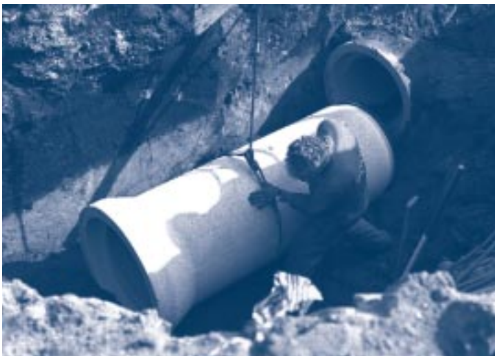
Graafmachine die als hijskraan wordt gebruikt

Bij beperkt hijsen dient op een hydraulische graafmachine ten minste de lepelsteelcilinder te zijn voorzien van slangbreukventielen. Het is niet nodig de zuigerzijde van de lepelsteelcilinder te beveiligen, als in de bedieningsvoorschriften is opgenomen dat de lepelsteel niet door de verticale stand (richting machine) mag worden belast.