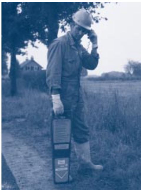
Controle op aanwezigheid van kabels en leidingen

Het werkterrein dient vóór aanvang van de werkzaamheden aandachtig te worden bekeken door de uitvoerder en de machinist van de grondverzetmachine. Hierbij dient te worden gelet op smalle en lage doorgangen, onder- en bovengrondse leidingen, putten, gaten, obstakels en de terreingesteldheid. Voor de aanwezigheid van ondergrondse kabels en leidingen moeten de eigenaren, beheerders of het KLIC (Kabels en Leidingen Informatie Centrum) worden geraadpleegd. Het verdient aanbeveling de kabels, leidingen en andere moeilijk zichtbare obstakels te markeren.